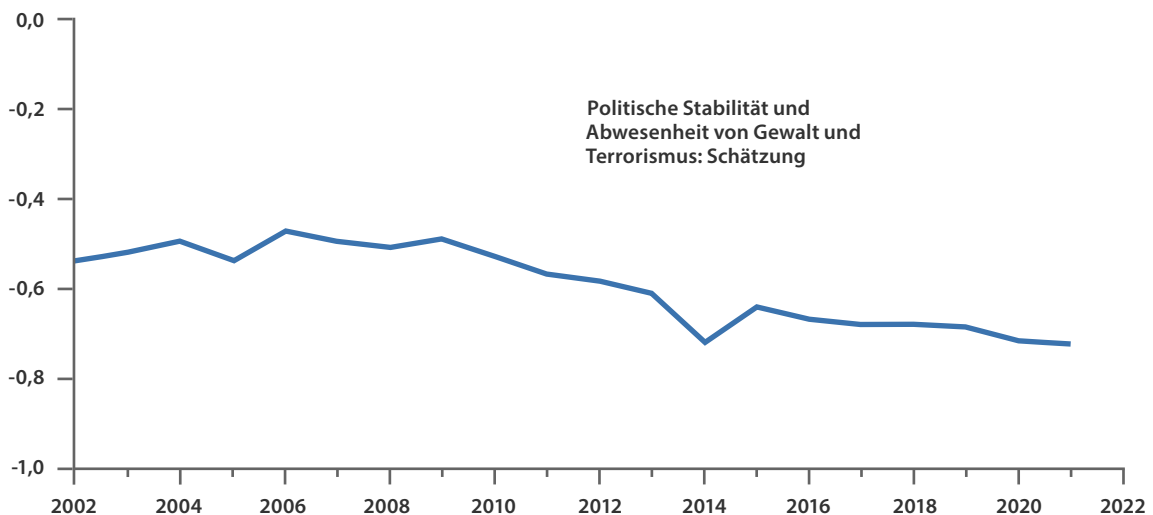
Abb. 3 Entwicklung politischer Stabilität in Afrika 1996 bis 2021

Konzentration auf Konflikte hoher Intensität zu einer Vernachlässigung von Aufgaben bei Aufstandsbekämpfungs-, Friedenssicherungs- und Anti-Terror-Einsätzen zur Folge hat. Absehbare, von staatlicher Fragilität in Afrika ausgehende Risiken für Europa sind somit Terrorismus und neuerliche Radikalisierung. Vor allem die Sahelzone dient, durch die Schwäche der dortigen Staaten, extremistischen Gruppen als Organisations-, Rückzugs- und Ausbildungsraum. Das Gebiet von Mauretanien bis Somalia wird von Terrorismusexperten schon seit längerem als Kandidat für ein zukünftiges Sanctuary bezeichnet. Des Weiteren scheinen westliche Staaten derzeit kein probates Mittel zu haben, um die subversive Einflussnahme Russlands in Afrika einzudämmen. Je mehr Instabilität Russland produzieren kann, desto mehr Einfluss wird es erwartungsgemäß ausüben können. Die antizipierte